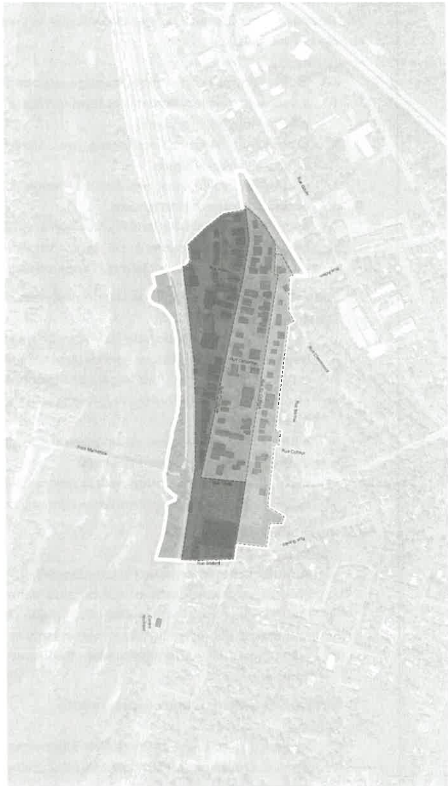
Figure 6 - Plan des hauteurs