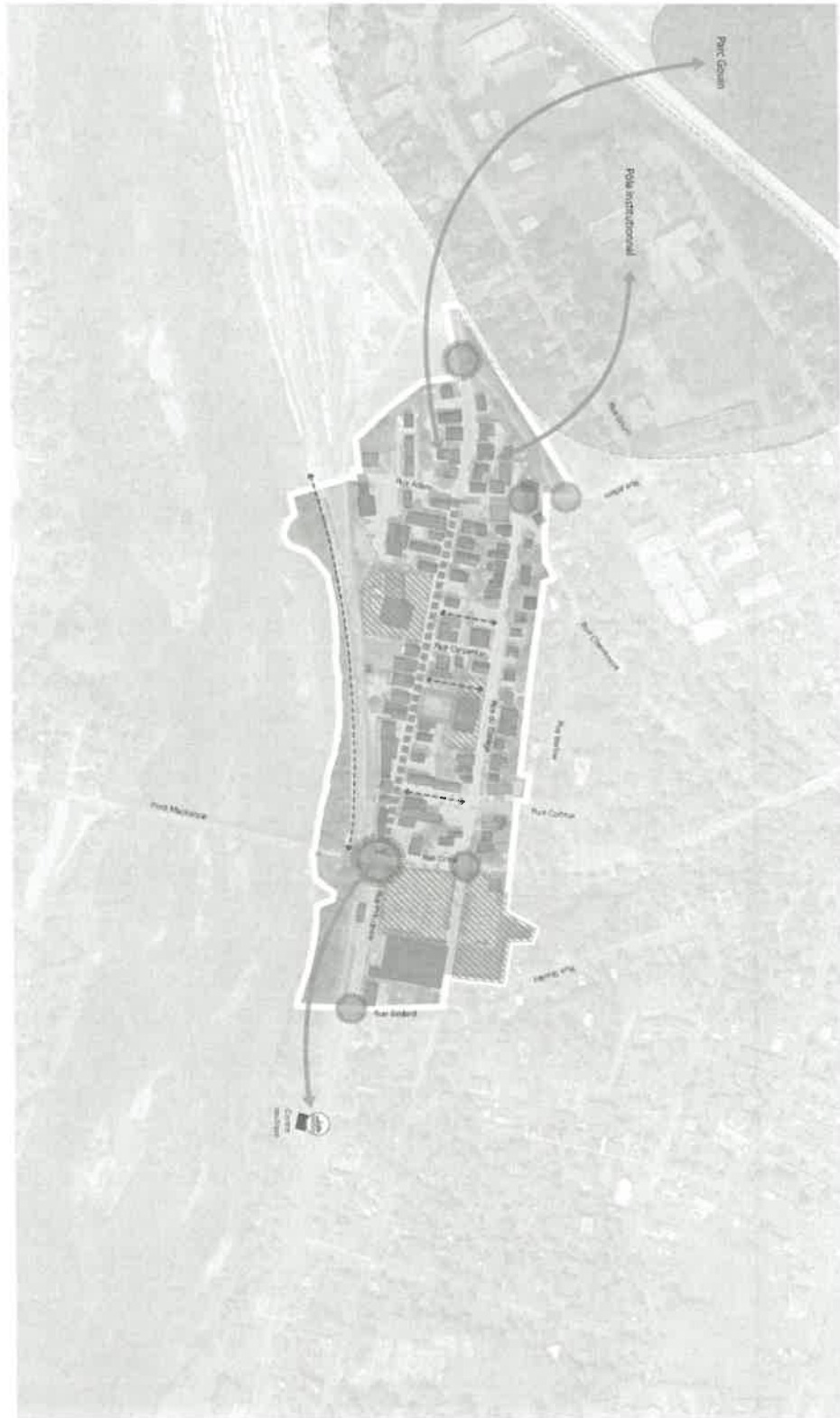
Figure 4 - Plan des affectations du territoire