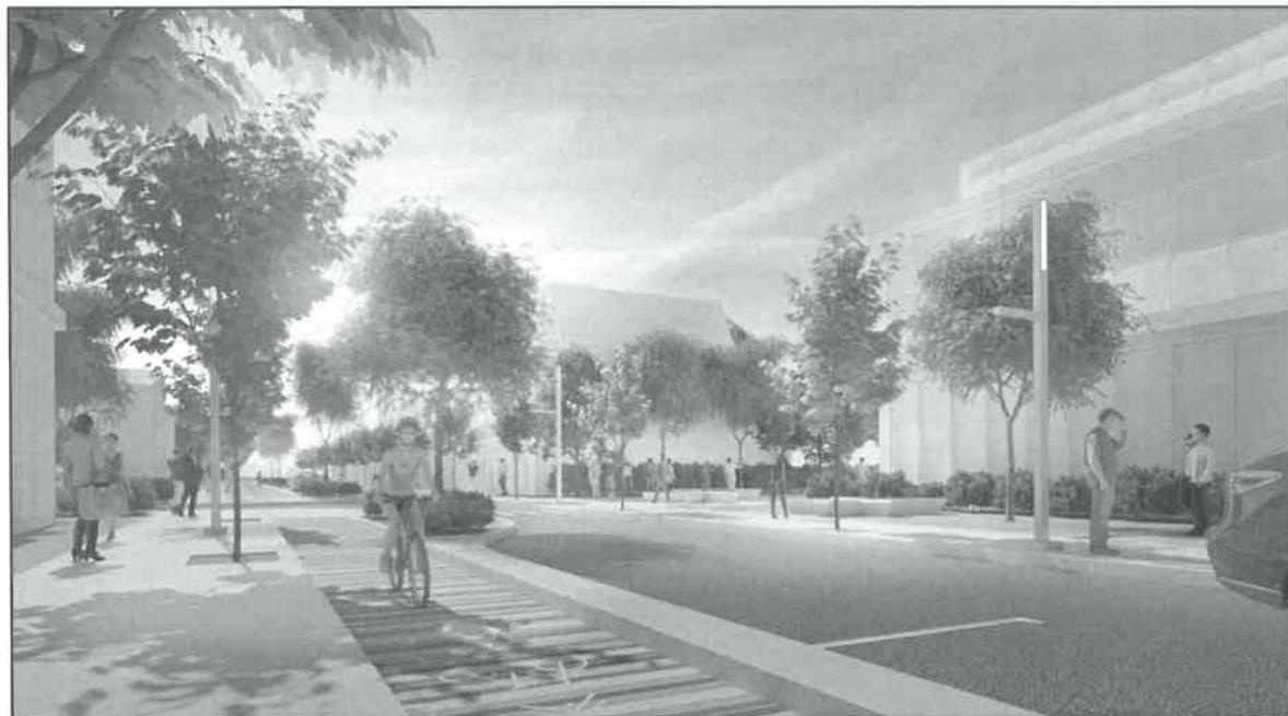
Figure 7 - Image d'ambiance de la rue Principale (à titre indicatif)

Les figures 7 et 8 sont des inspirations de ce que pourrait être la future rue Principale.