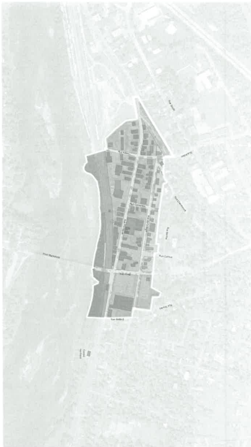
Figure 5 - Plan des affectations du territoire